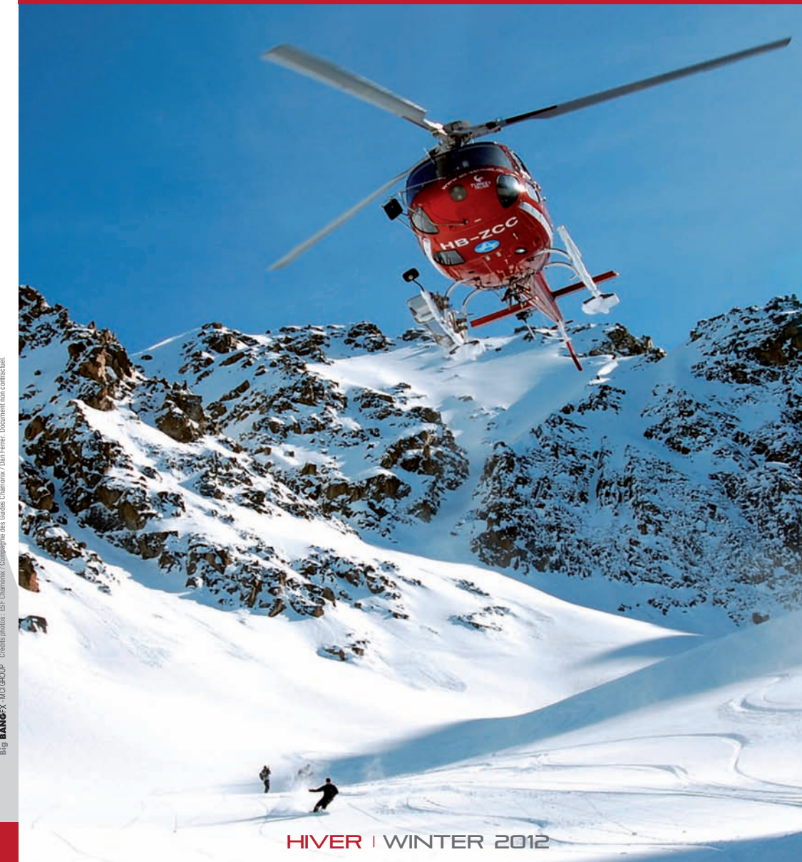
Big BANGFX - MO GROUP - Crédits photos : ESF Chamonix / Compagnie des Guides Chamonix / Dan Ferrer. Document non contractuel.